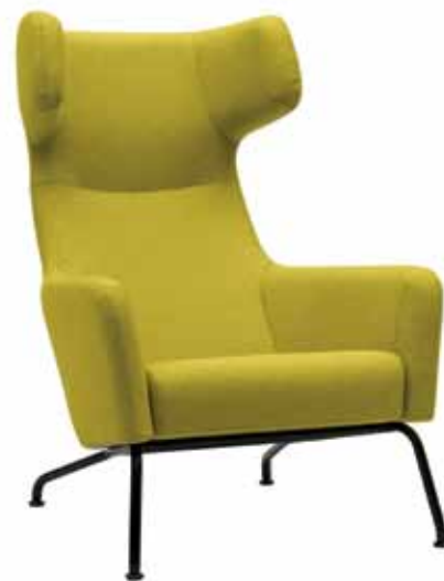
Pořádný ušák v obývacím pokoji někdy předčí tu nejlepší sedačku

Pokud jsou tyto relativně technické části vyjasněny, přichází na řadu samotný styl. Mladý pár bude mít jiné požadavky na materiály než starší pár nebo velká rodina. Starší lidé jsou například více konzervativní a těžko půjdou do úplných novodobých materiálů, jako je plast nebo kov.